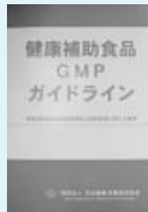
健康補助食品 GMP ガイドライン 会員価格 2,000円 非会員価格 4,000円

健康食品部会員には、10 月 17 日付にて既に「健康補助食品 GMP ガイドライン」をお送りしたところですが、「健康補助食品 GMP に関する Q & A」を健康食品部会員に同封しますので、社内教育等にお役立てください。